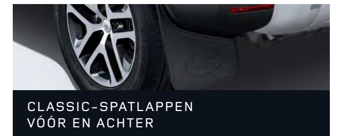
CLASSIC-SPATLAPPEN VÓÓR EN ACHTER