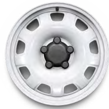
18" 5-Spoke, 'Style 5093', staal, in Fuji White