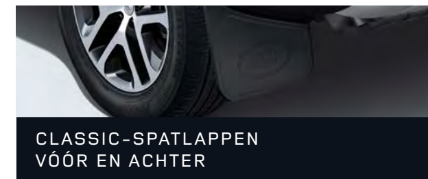
CLASSIC-SPATLAPPEN VÓÓR EN ACHTER