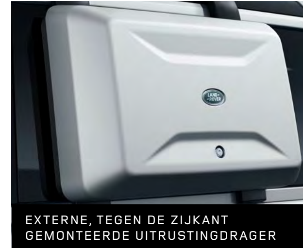
EXTERNE, TEGEN DE ZIJKANT GEMONTEERDE UITRUSTINGDRAGER