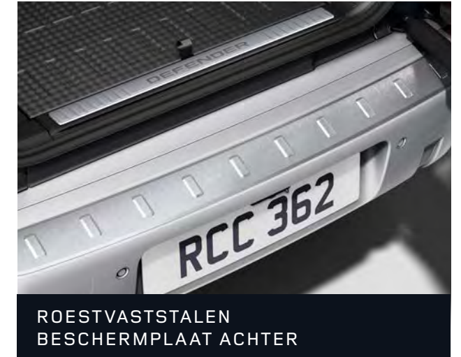
ROESTVASTSTALEN BESCHERMPLAAT ACHTER