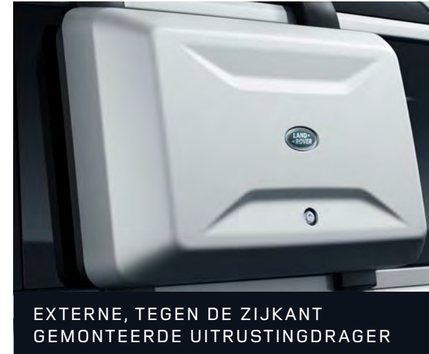
EXTERNE, TEGEN DE ZIJKANT GEMONTEERDE UITRUSTINGDRAGER