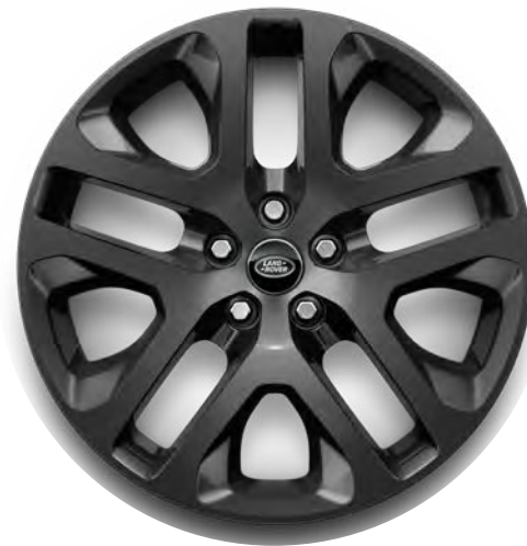
20" 5-Split Spoke, 'Style 5095' in Dark Grey