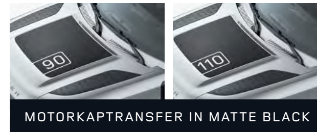
MOTORKAPTRANSFER IN MATTE BLACK