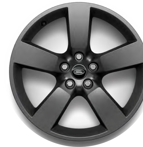
20" 5-Spoke, 'Style 5098' in Dark Satin Grey