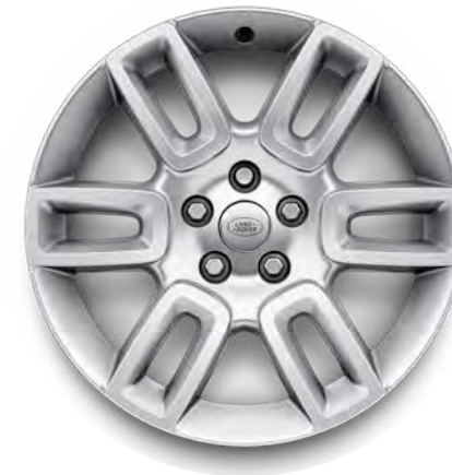
19" 6-Spoke, 'Style 6010' in Sparkle Silver