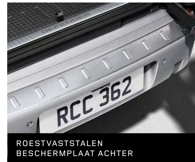
ROESTVASTSTALEN BESCHERMPLAAT ACHTER