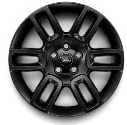
19" 6-Spoke, 'Style 6010' in Gloss Black