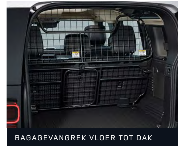
BAGAGEVANGREK VLOER TOT DAK