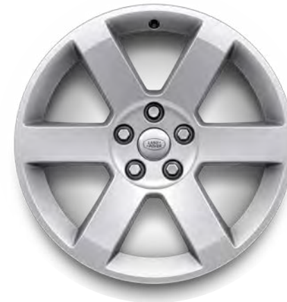
19" 6-Spoke, 'Style 6009' in Sparkle Silver