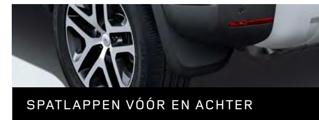
SPATLAPPEN VÓÓR EN ACHTER