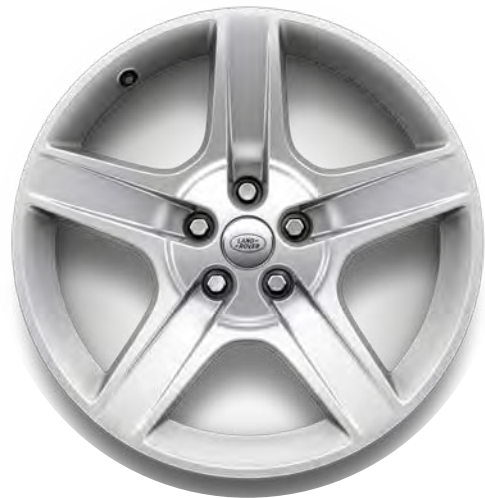
20" 5-Spoke, 'Style 5094' in Sparkle Silver