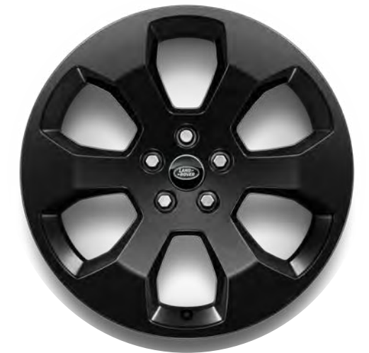
20" 6-Spoke, 'Style 6011' in Gloss Black