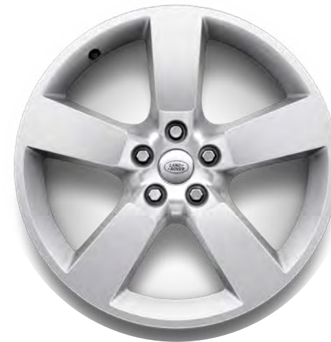
20" 5-Spoke, 'Style 5098' in Sparkle Silver