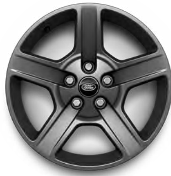
18" 5-Spoke, 'Style 5094' in Dark Satin Grey

Personaliseer uw auto nog verder met een van onze lichtmetalen velgen. Maak een keuze uit een uitgebreid programma eigentijdse en dynamische designs.