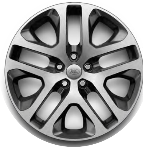
20" 5-Split Spoke, 'Style 5095' in Dark Grey & Diamond Turned Finish